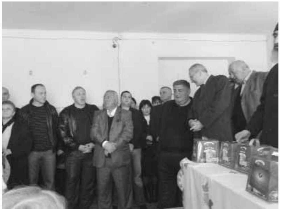
აფხაზეთის ა/რ-ის მთავრობა

„დღეს აღდგომის ნათელი აღგვავსებს და განგვანათლებს ყოველთა. აღდგომის მადლი გვიყუჩებს სულიერ თუ ხორციელ ტკივილებს.“ აფხაზეთიდან დევნილმა მოსახლეობამ უმძიმესი წლები გამოიარა. დღემდე მოუშუშებელია მათი ჭრილობები. ხალხის თვალწინ დაიღუპა უამრავი ახალგაზრდა, საკუთარ სახლ-კარს მოწყდა და დღემდე ლტოლვილობაშია მოსახლეობის უდიდესი ნაწილი. მაგრამ ყველაზე დიდი უბედურება ის გახლავთ, რომ აფხაზეთის მინა-წყალზე, განადგურების პირას მივიყვანეთ ღვთისაგან ბოძებული უმთავრესი საუნჯე — სიყვარული. შეიძლება ვინმე არ დაგვეთანხმოს და გვითხრას: — სიყვარული არ დაგვიკარგავს, გვიყვარს ჩვენი ოჯახის წევრები, ნათესავები და მეგობრები. ის მაინც ხომ შეგვიძლია ვაღიაროთ, რომ ყველაფერი, რაც აფხაზეთში მოხდა ამა თუ იმ ადამიანთა ჯგუფის დანაშაული კი არ არის, არამედ ყოველი ჩვენგანის უძღურების, უსიყვარულობისა და ღმერთთან დაცილების შედეგია. სიყვარული არ იქნება იქ, სადაც ადამიანები საკუთარ თავში ხედავენ სიკეთეს, ხოლო მოყვასში ბოროტებას. ნუ შევეცდებით ჩვენს ცხოვრებაში არსებული ტრაგიკული მოვლენების მიზეზი მხოლოდ სხვა ადამიანებში დავინახოთ, ხოლო საკუ-