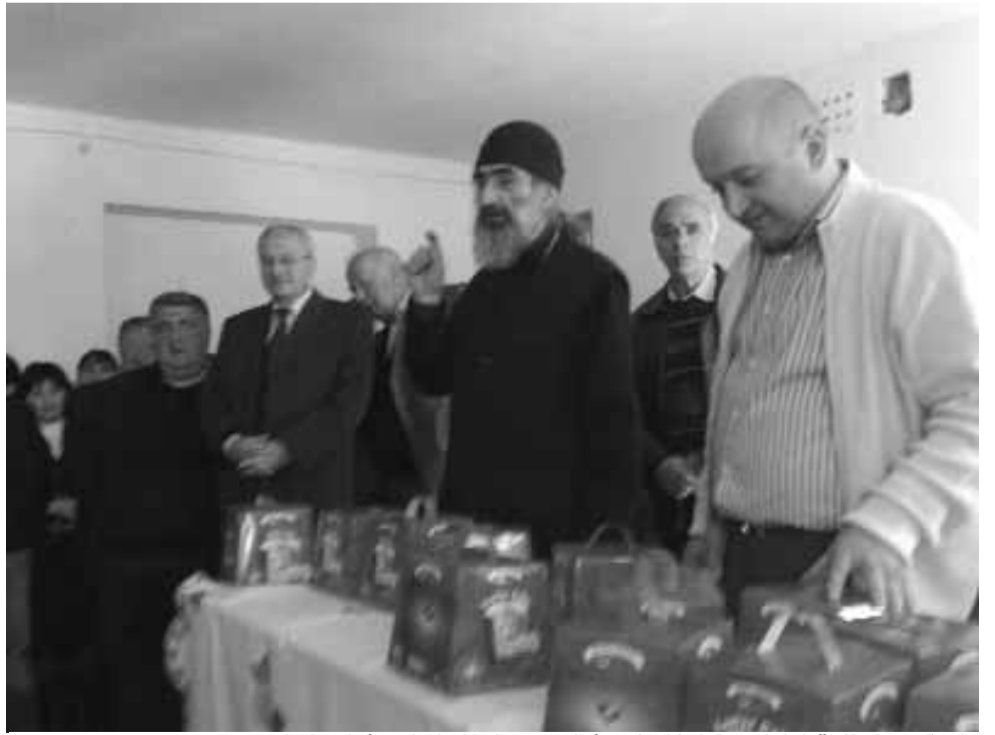
ცხუმ-აფხაზეთის ეპარქიისა და აფხაზეთის ა/რ-ის მთავრობის წარმომადგენლები