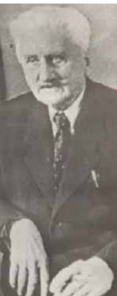
თეატრის კარი“ (ი. ვართაგავა, დასახ. ნიგნი; გვ. 36-37).

მამის ეს ძვირფასი ანდერძი შვილმა სათუთად ჩაიღო უბეში და მოკრძალებით შეალო