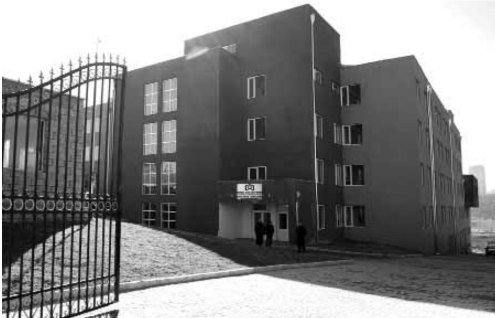
■ სპორტული აღზრდა – გამაჯანსაღებელი ვარჯიშები, ცურვა.