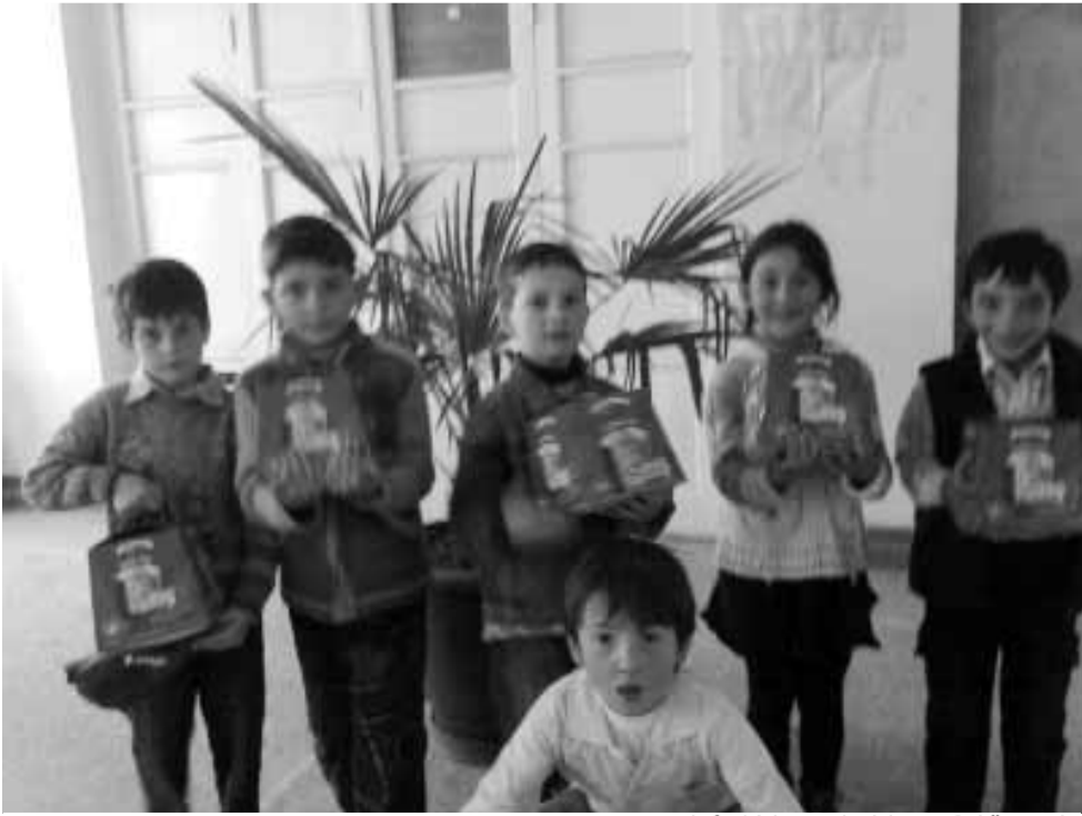
საჩუქრებით გახარებული მოსწავლეები