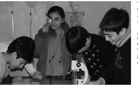
ნიშნული დისციპლინების სწავლების პროცესი კიდევ უფრო საინტერესო გახდება – აღნიშნა კოკა სეფორიაშვილმა და მოსწავლეებთან ერთად ცდები ჩაატარა.

საქართველოს განათლებისა და მეცნიერების მინისტრმა დიმიტრი შამუგინმა და გარემოს დაცვისა და ბუნებრივი რესურსების მინისტრმა გიგა ხაჩიძემ თბილისის №123 სკოლის დაწყებითი კლასის მოსწავლეებს ამინაციური ფილმი „ოპოკო და გვანცა“ წარუდგინეს. ინფორმაციულ-მეცნიერული ხასიათის ფილმი გერმანიის ტექნიკური თანამშრომლობის საზოგადოების (GIZ) მხარდაჭერით შეიქმნა და მიზანდასახულია მოზარდი თაობის ინფორმირებას ბიომრავალფეროვნების სასიცოცხლო მნიშვნელობის შესახებ.