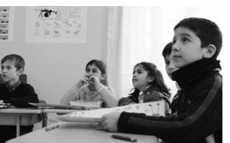
ვი რესურსების სამინისტროს წარმომადგენლებმა 123-ე საჯარო სკოლის მოსწავლეებს გაკვივითების ცნობილი გადასაცემის გარემოსდაცვითი სლოგანი, რომელიც სპეციალურად „ბიომრავალფეროვნების საერთაშორისო წლის“ ფარგლებში დაიბეჭდა.

სკოლებში საბუნებისმეტყველო საგნების სწავლების დონის ამაღლებას და ამ საგნებით მოსწავლეთა დინტერესების მიზნით, საჯარო სკოლებში პროგრამის განხორციელება 26 ოქტომბრიდან ეტაპობრივად მიმდინარეობს.