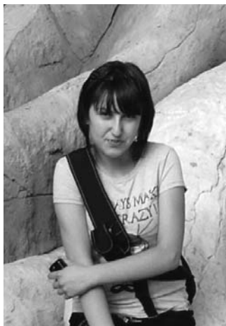
სალონი ლუდუმიკი IX კლასი, სკოლა-ლიცეუმი „თამარისი“

ჯერ კიდევ უძველეს დროში ადამიანები თავისუფლების მოსაპოვებლად იბრძოდნენ. ზოგისთვის ეს დამოუკიდებლობასთან ან თუნდაც მუხლდავ უფლებებთან ასოცირდებოდა. ზოგადდ თავისუფლება აბსტრაქტული ცნებაა. ის ლექსიკონში განმარტებულია, როგორც „ნების გამოშვანების შესაძლებლობა; ანარქიზმა ისეთი პირობისა, რომელიც ზღუდას რომელიმე კლასის, მთელი საზოგადოების ან მისი წევ-