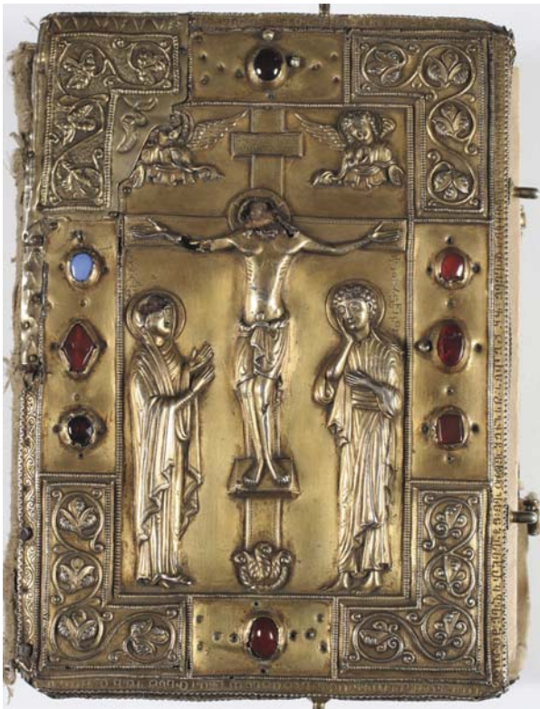
ბერთის სახარება. XII საუკუნე

ვა. დაუუკავშირდით რამდენიმე ქვეყნის წარმომადგენელს – ხელოვნებათმცოდნეებს, ისტორიკოსებს, ფილოლოგებს, ეთნოგრაფებს, ვინც კონკრეტულად ტაო-კლარჯეთის რეგიონით და მისი შესწავლითა დაკავებული. კონფერენციაში მონაწილეობა მიიღო 7 ქვეყნის წარმომადგენელმა: აშშ, დანია, რუსეთი, თურქეთი (რაც განსაკუთრებულად საინტერესოა), სომხეთი, თავისთავად საქართვე-