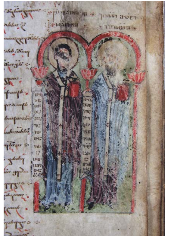
მიქაელ მოდრეკილის იადგარი. X საუკუნე