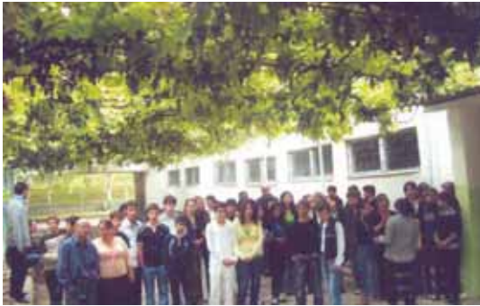
15 სექტემბერს კახეთის პროფესიულ სასწავლო ცენტრში მოხდა აღსაზრდელების სასწავლებლის კარი დაკეტილი დახვდით და უკან მოუწიათ გაბრუნება