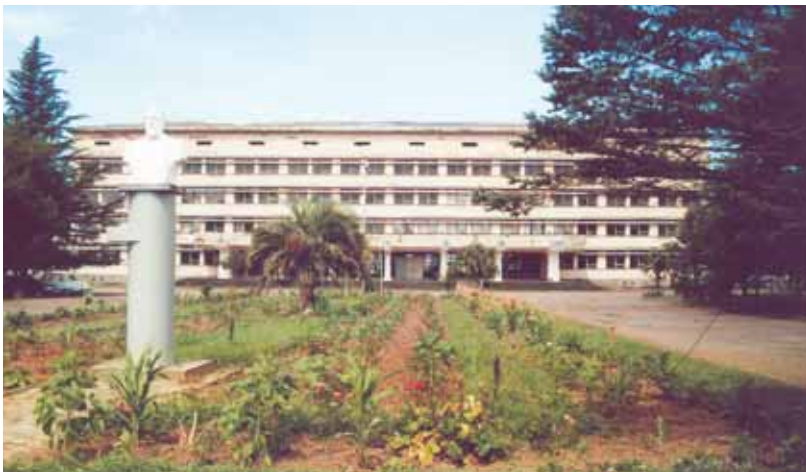
დიდი ჯიხაშის პროფესიული სასწავლო ცენტრი

- არ არსებობს საქართველოს პრემიერ-მინისტრის მიერ ხელმოწერილი არავითარი დოკუმენტი, რომელიც შეიძლება ამ ბრძანების საფუძველი ყოფილიყო. თავად ბრძანებაში მითითებულია, რომ 14 სექტემბრის ბრძანება გამოცემულია განათლების მინისტრის 10 სექტემბრის №86-6 ბრძანების საფუძველზე და მისი მიზანარს მართლაც ცალკე საუბრის თემაა. პირველი პუნქტი, სადაც ჩამოთვლილია ლიკვიდირებული სასწავლებლები, მოაგრდება ფრაზით: „ლიკვიდაციასთან დაკავშირებული ღონისძიებები დასრულდეს 2010 წლის 15 სექტემბრამდე“, მეორე პუნქტი -