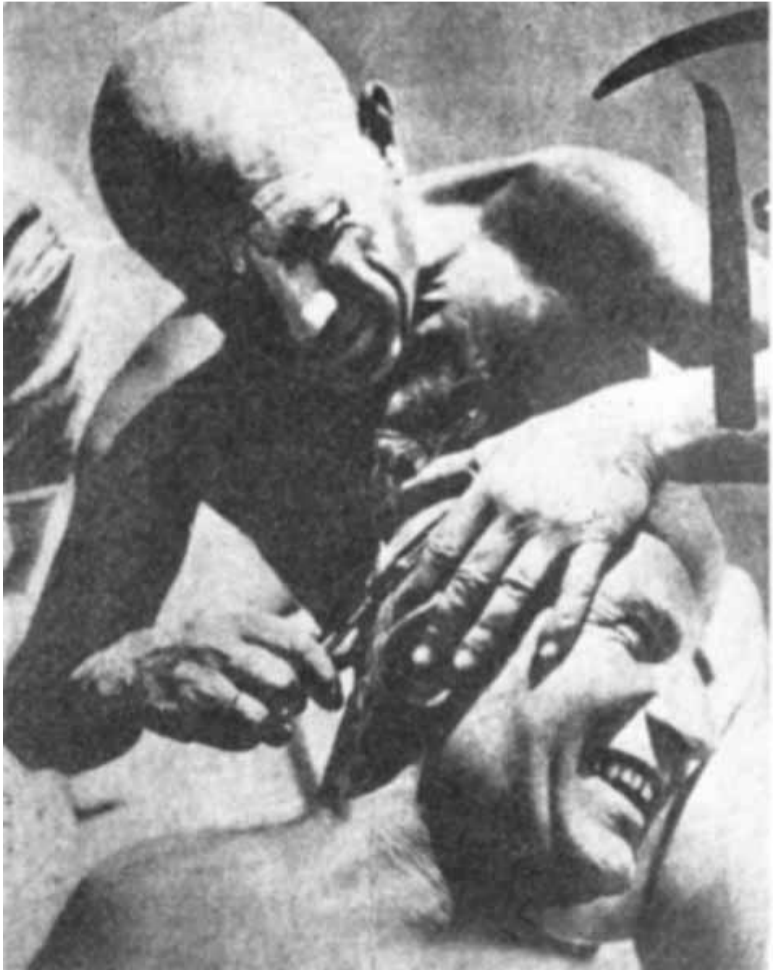
პიკასო და ილიაზდი

...ერთ საღამოს, 1912 წლის ზაფხულის დასაწყისში, მოხდა ის, რაც დღემდე მალეუვებს, მახარებს და მათბობს. მე ვიხილე იდუმალი მხატვრის ნამუშევრები, რომლებმაც შეგვძრეს მე ჩემი მეგობარი ლე დანტიუ და ჩემი ძმა ილია. მანამდე თბის რამდენიმე მშვენიერ ნაკეთობას მივაგენით, რომელზეც ძველი ხელოვნების კვალი შეიმჩნეოდა... მაგრამ ეს საკმარისი არ იყო, ჩვენ ვეძებდით უფრო მნიშვნელოვანს, გვეჩვენებოდა, რომ ამ თვითმყოფად ქალაქში, სადაც ამდენი სინათლეა, სადაც ამდენი ნიჭიერი ხალხია, აღმოვაჩინებ დიდ ხელოვნებას. საღამო ხანს ქალაქში ხეტიალისას, მივუახლოვდით ვაგზის მოედანს, რომელიც უკვე საღამოს სიღრუჯში ჩაძირულიყო. ფარნები ანათებდნენ აბრებს, ჩვენი ყურადღება დუქან „ვარიაგის“ აბრამ მიიპრო, რომელზეც საზღვაო ბრძოლა იყო გამოსახული. კრეისერი, რომლის საპატივცემულოდ იყო დანესებულების სახელი შერჩეული, სწრაფად მისრიალებს ზღვაზე, ყველა მილიდან კვამლის ბოლქვებს უშვებს და მტერს ცეცხლს უშენს. იარაღის ლულებიდან ცეცხლის ალი იფრქვევა, მრგვალი ბოლქვები ცისკენ მიფრინავს, მღელვარე ტალღები კი აბრის ჩარჩოს ეხეთქება. შევედით და დავინახეთ, კედლებზე უნესრიგოდ მიმოკიდებული სურათები, ნახევრად ბნელ დუქანში ისინი ცუდად ჩანდნენ, მაგრამ თანდათან თვალბმა შეჩვევა დაინყეს... დიდებული და ზორბა მამაკაცი გრძელი უღვაშებითა და მალა ანეული ყანწით ხელში, დიდრონი შავი თვალბით მკაცრად გვიმზერდა. მისი თვალბის სიშავე ხაზგასმული იყო შავი წარბებით, თეთრი სახე ღია ლურჯი ცის ფონზე ანათებდა. ჩვენ ვიხილეთ ფერწერა, რომლის მსგავსი ადრე ამდაგვარ დაწესებულებებში არ გვინახავს. ბუზებით მოსვრილი ოლიოგრაფის ნაცვლად, ასეთი განსაცვიფრებ-