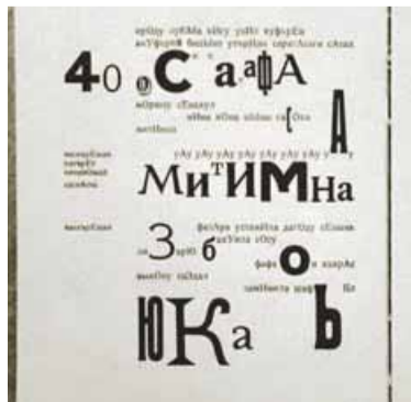
დასასრული მე-10 გვერდზე

კირილ ზდანევიჩი 1969 წელს გარდაიცვალა, დაკრძალულია დიდუბის პანთეონში. 1975 წელს – ილია ზდანევიჩი, იგი ლევილის ქართულ სასაფლაოზე დაასაფლავეს.