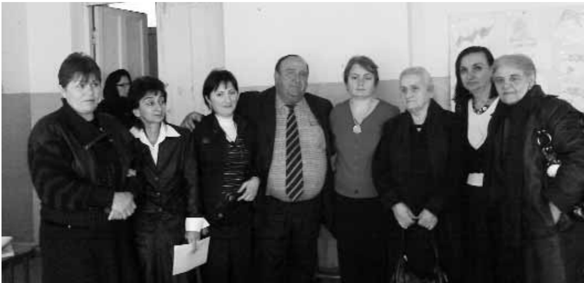
ბავშვთა პარმონიული განვითარების ცენტრის თანამშრომლები და ჟიური