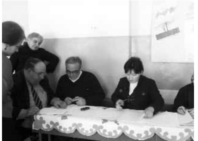
კონკურსის ჟიურის წევრები ნამუშევრების გასწორების პროცესში