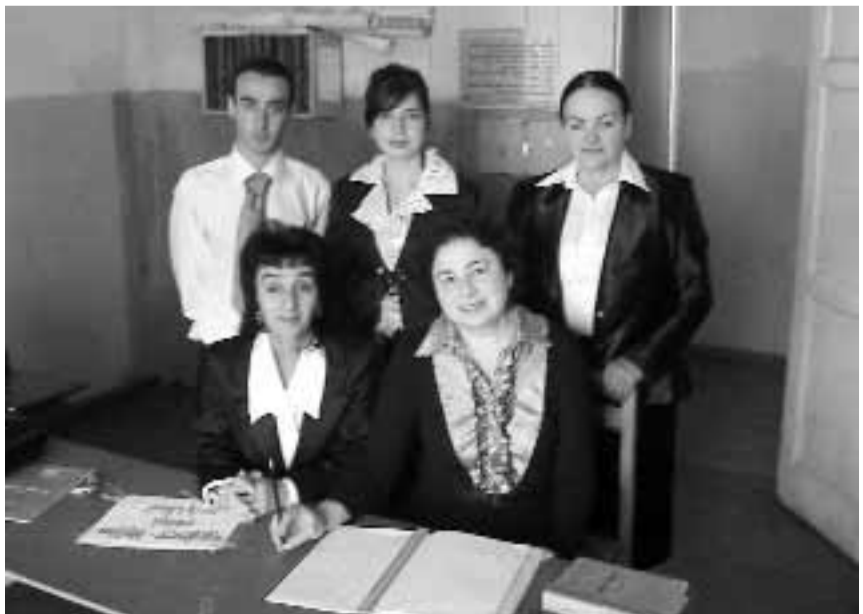
ზუგდიდში აბიტურიენტთა მოსამზადებელი კურსების პედაგოგები

P.S. აღსანიშნავია, რომ გასული წლების მონაცემებისა და შედეგების მიხედვით, მოსამზადებელი კურსები ძალიან ეფექტიანი გამოდგა. ამის დასტურია თუნდაც ის ფაქტი, რომ ყოველ შაბათ-კვირას აფხაზეთის №1 საჯარო სკოლაში მოდიან შარშანდელი კურსდამთავრებულები (უკვე სხვადასხვა უმაღლეს სასწავლებელში ჩარიცხული სტუდენტები). ისინი კმაყოფილებას და მაღლიერებას გამოთქამენ ადაპტაციის, პროექტის მხარდაჭერის, აფხაზეთის განათლებისა და კულტურის სამინისტროს მიმართ. წლებადეულ აბიტურიენტებს კი წარმატებას და მათი ბედის გაზიარებას უსურვებენ. დევნილი ადაპტაციისა და აბიტურიენტების საწესდარ ოცნებად, ისევ და ისევ, გმობლიურ აფხაზეთში დაბრუნება რჩება.