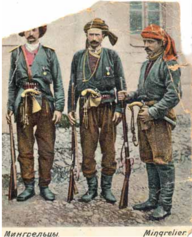
საუკეთესო ბიოგრაფის, ფლეიმანის წიგნში „რუსტამი ნაპოლეონის მამლუქი“.

შარშან, სექტემბერში, გაზეთ „კვირის პალიტრაში“ გამოქვეყნდა ერთი საინტერესო სურათი. მას ქვემოთ ანერია „მეგრელები“, ხოლო უკანა მხარეს, წითელი პასტით, გაკეთებული აქვს მინაწერი „მეგრელები ნაპოლეონის ბრძოლებში“. რამია საქმე? აქ ორი ვერსია შეიძლება არსებობდეს: პირველი - ესენი არიან მეგრელები, რომლებიც იბრძოდნენ რუსეთის არმიამ ნაპოლეონის წინააღმდეგ. მეორე, რაც კიდევ უფრო დამაინტრიგებელია, ეს მეგრელები მსახურობდნენ ნაპოლეონის არმიას. პირველი ვერსია სავსებით ლოგიკურია და მასში გასაკვირი არც არაფერია. რაც შეეხება მეორე ვერსიას, ფიქრობ, საინტერესო უნდა იყოს. ამიტომ გავყვიეთ მას. იბრძოდნენ თუ არა ეს მეგრელები ნაპოლეონის არმიას? კატეგორიულად რაიმეს მტკიცება ძალზე ძნელია, მაგრამ არც არაფერს არ უარყოფთ. თითქოსდა ამ ვერსიის სასარგებლოდ ლაპარაკობს სამფეროვანი სამკერდე ნიშანი (საფრანგეთის დიდი რევოლუციის შემდეგ საფრანგეთს ჰქონდა სამფეროვანი დროშა - წითელი, თეთრი, ლურჯი ფერებით), მაგრამ ეს არაფერს არ ნიშნავს. ასეთი ნიშანი შეიძლება ჰქონოდა სხვა ქვეყნის (კალკულ სამხედრო შენაერთებს. ეს სხვა საკითხია, რომელსაც ამჯერად არ შევეხებით.