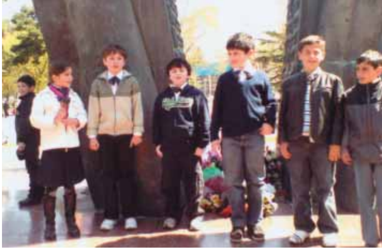
თავყვანი ვცეთ ჩვენს უძველეს, უმდიდრეს და ულაშაზეს ენას. „სივყარულის, ლექსის, სადღეგრძელოს ენავ, ხმათა ხვერდების და ღმერთების ენავ!“