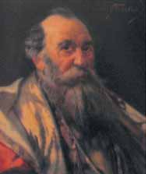
ფილიმონ ქორიძის პორტრეტი, გიგო გაბაშვილი