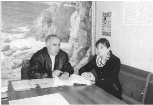
„გთხოვ, მომისმინე, შენ, ექიმო, გთხოვ მომისმინე: დარდი ბევრი მაქვს, ნამალი კი მაქვს მხოლოდ ერთი, უპირო კაცთან არასოდეს არა მაქვს საქმე, მართალ კაცთან კი მეც მართალი მინდა რომ ვიყო!“

იგი აზერბაიჯანულ ენაზე წერს ლექსებს, ქართულად არაჩვეულებრივად საუბრობს. მის პოეზიას თარგმნის ამავე სკოლის მასწავლებელი ნინო ნანუაშვილი :