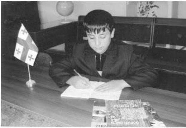
თველოს სრულფასოვანი მოქალაქეობისათვის, ეთნიკურად აზერბაიჯანელ ბავშვებს სკოლაში ქართულ ენასა და ლიტერატურას ასწავლის“.

ნინოს მეორე პოეტური კრებული 2007 წელს გამოიცა, სახელწოდებით „შენ“. წინათქმაში რატი ამალალოელი წერს: „...ნინომ თავისი ცხოვრება სრული შეგნებით ლიტერატურას დაუკავშირა, შემთხვევითი არც ის არის, რომ თავისი ქალაქიდან არცთუ ისე ახლოს მდებარე სოფელში, მომავალი საქარ-