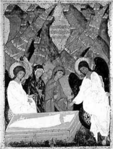
„და ვითარცა-იგი ადამის გამო ყოველნი მოსწყდებიან, ეგრეთცა ქრისტეს მიერ ყოველნი ცხოველ იქმნენ.“ (1 კორ. 15:22)

საშუალება უნდა მისცემოდა, თავისი ადგილი თვით ქრისტეშიც ეძებნა. სიკვდილი უფალში ვერ დამკვიდრდა, რადგან ქვეყნიერებაში და უკვდავებაში მან საკუთარი თავი ვერ იპოვა“. ამრიგად, თუ მაცხოვრის განკაცება ცოდვაზე გამარჯვება და ადამიანის ღმერთთან ურთიერთობის საფუძველია, იესო ქრისტეს ჯვარცმა ცოდვით დაცემის შედეგად გაჩენილი წყევისაგან გამოსხნა და კაცობრიობის გამოსყიდვაა. ქრისტემან ჩუენ მოგყვინდა წყევისა მისგან შჯულისა და იქმნა ჩუენთვის წყევასა ქუეშე. რამეთუ წერილ არს: წყულ იყავნ