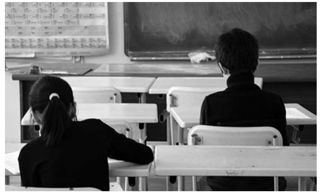
პირველი ექვსი კლასის მანძილზე მიღწეული წარმატებები კი - მე-7 კლასელების ტესტირების შედეგად.

პროექტი „შეფასება განვითარებისათვის“ მიზნად ისახავს მეოთხეკლასელთა და მეექვსეკლასელთა მიღწევების შეფასებას ქართულსა და მათემატიკაში. პირველ ოთხ კლასში მიღწეული შედეგები მე-5 კლასის დასაწყისში შეფასდება,