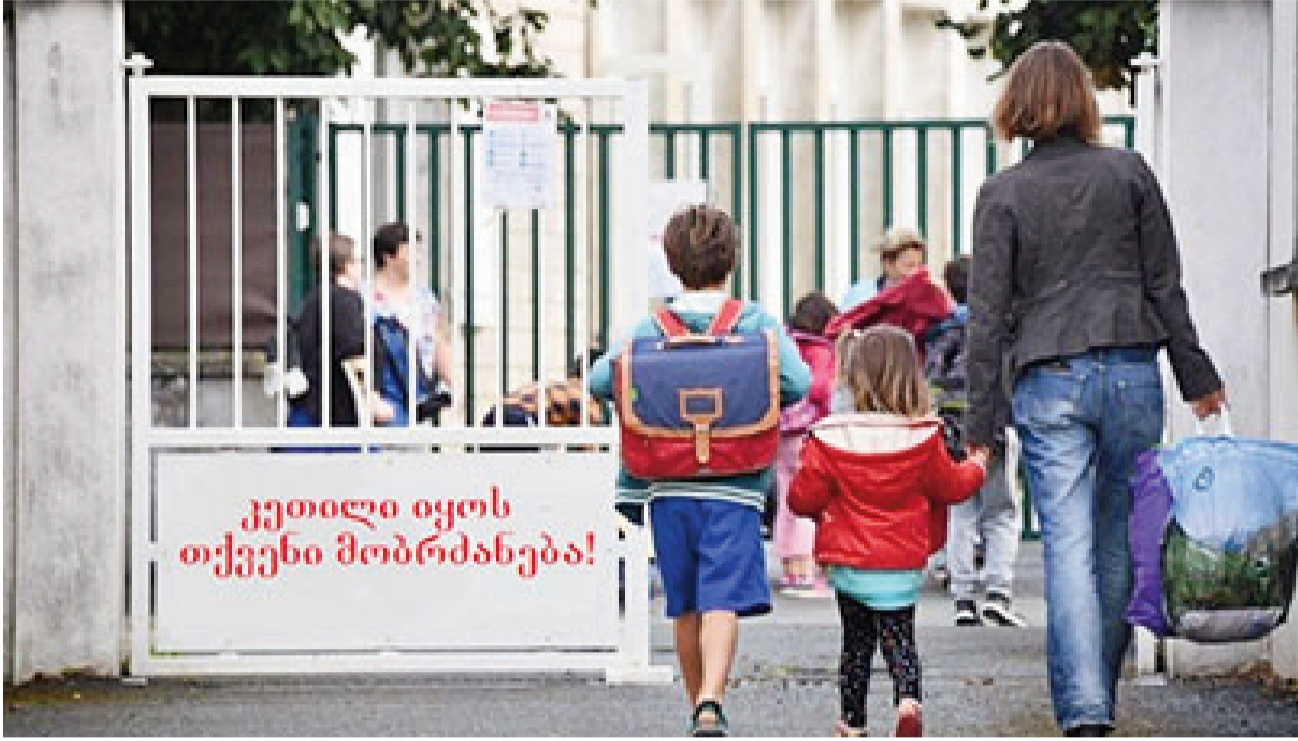
დაიწყო, რადგან მანამდე, არდადეგების პერიოდში, გაურკვეველი იყო რა გველოდებოდა – არ ვიცოდით ვაგრძელდებოდა თუ არა სწავლა სკოლებში. კერძო სკოლები ყველაზე მეტად იყვნენ ზუმს, ფეისბუქ მესენჯერს – შექმნილი აქვთ ჯგუფები, ასევე აქტიურად გამოიყენება ძალიან კარგი ქართული პროდუქტი „სკულ ბუქი“.