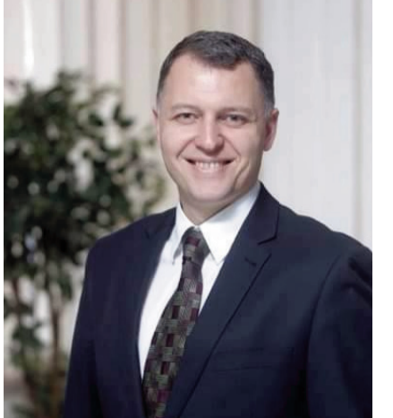
გიორგი ფსაკაძე გაეროს გენერალური მდივნის მრჩეველი ჯანდაცვის საკითხებში, დავით ტვილდიანის სამედიცინო უნივერსიტეტის პროფესორი, საზოგადოებრივი ჯანდაცვის სკოლის ხელმძღვანელი, გაეროს ცენტრალური მდივნის დამოუკიდებელი ანგარიშვალდებულების პანელის (EWEC) წევრი; შიდათან, ტუბერკულოზთან და მალარიასთან ბრძოლის გლობალური ფონდის ტექნიკური განხილვის პანელის ექსპერტი; ვაქცინებისა და იმუნიზაციების გლობალური ალიანსის (GAVI) პნევმოკოკის წინასწარი საბაზრო შეთანხმების (AMC) დამოუკიდებელი შეფასების წევრი

ყოველთვის ვცდილობ, დაეკავშირდე საზოგადოების ინტერესებს და შევთავაზო ინიციატივები იმ თემებზე, რომლებიც მათი ყურადღების ცენტრშია. ჩვენ გავაგრძელებთ თანამშრომლობას ბატონ გიორგისთან, ახლო მომავალში კიდევ ვგეგმავთ მის ჩართვას ძალიან საინტერესო თემებზე და გვქენება სხვა მნიშვნელოვანი ლაივ ჩართვებიც, საზოგადოებისთვის ცნობილ ადამიანებთან. მთავარია, რაც შეიძლება ბევრმა ადამიანმა გვა-