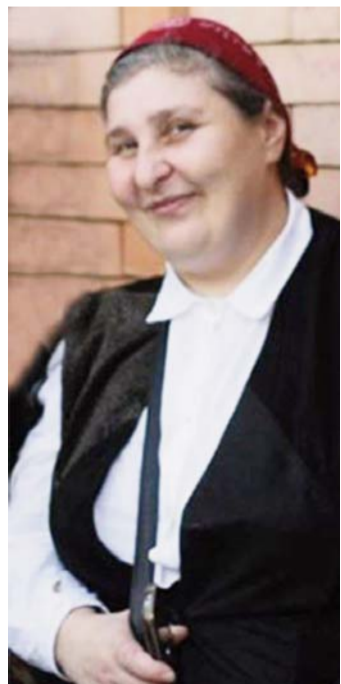
ნინო ტონია ა/ა/იპ საქართველოს საპატრიარქოს წმინდა მიტროპოლიტ ნაზარი ლუვაჯას სახელობის სამტრედიის მართლმადიდებლური სკოლის ქართული ენისა და ლიტერატურის მასწავლებელი

✓ სახლი მშვენიერი საწყაროა დამტვირთი სივრცეა! ✓ სახლი შევეცნობის ათვლის წერტილია!