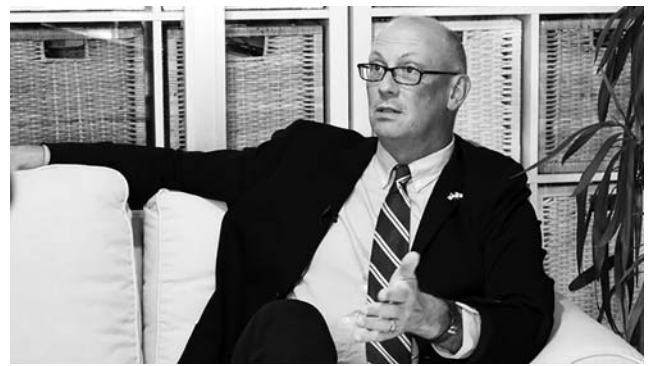
მხარს პროფესიულ-ტექნიკურ განათლებას და საგანმანათლებლო რეფორმებს.

პროგრამის განხორციელება სხვადასხვა ინსტიტუციების ჩართულობასაც გულისხმობს. USAID-ის საქართველოს მისიის ხელმძღვანელი ამბობს, რომ ახალი პროგრამა არა მხოლოდ განათლების სამინისტროსთან, არამედ არაერთ სხვა დაინტერესებულ მხარესთან კონსულტაციების შედეგად შეიქმნა. „ფართო მასშტაბის კონსულტაციები გავიარეთ, რათა დაგვედგინა საჭიროებები და სამიზნედ ის სფეროები აგველო, რომელზეც ცვლილებების განხორციელება შეგვიძლია. ჩვენ აქტიურად ჩავართეთ სამინისტროს წარმომადგენლობა მესყიდვისა და იმ პარტნიორის შერჩევის პროცესში, რომელიც პრაქტიკულად განხორციელებს ამ პროგრამას USAID-სთვის. ერთობლივად ვიმუშავეთ პროგრამის შექმნაზე, ზოგადად, განათლების სისტემაში მიმდინარე რეფორმები არა მხოლოდ აშშ-ს, არამედ საქართველოს ბევრი სხვა საერთაშორისო მეგობრის ძალისხმევით ხორციელდება. მოგეხსენებათ, მსოფლიო ბანკმა, წარსულში, დიდი ოდენობის ინვესტიციები ჩადო და კიდევ გვამავს ახალ, მსხვილ ინვესტიციას განათლებაში, რათა ხელი შეუწყოს მთავრობის რეფორმებს. ვიცი, რომ გერმანიის ხელისუფლება უჭერს