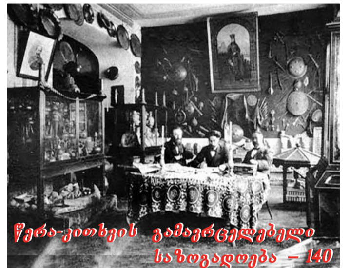
წერა-კითხვის გამავრცელებელი საზოგადოება – 140

✓ 1878 წლის 20 ივნისს, 126 დამფუძნებლის ხელმო-წეხით, იღია ქავქავაქემ, დიმიტეი ყიფიანმა და ბესა-ხიონ ლოლობეიქიმ ნესდება დასამტეიციებლად ნახე-გინეს ქავქასიის მეფისნაცვალს. გიოგორ მხბელიანის წინადებლით საზოგადოებას „ქახივეღთა შიხის ნე-ხა-კითხვის გამავრცელებელი საზოგადოება“ ეწოდა.