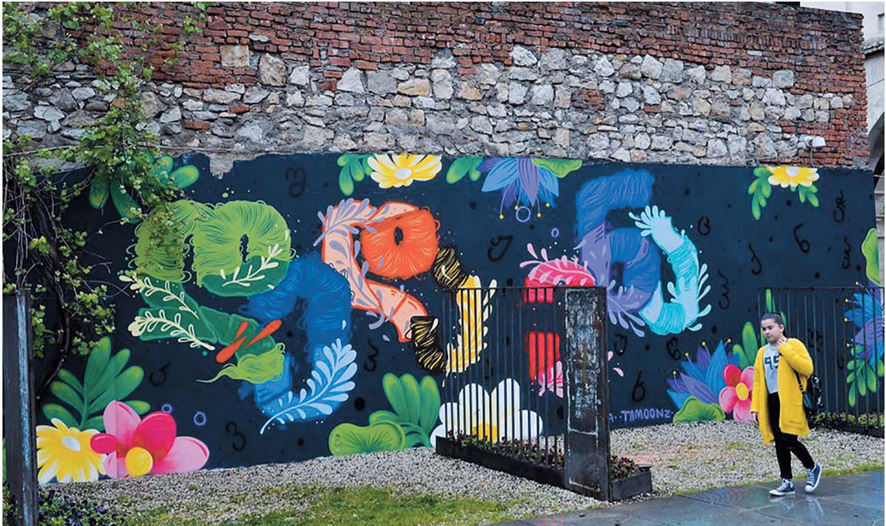
ღელანით მოხატული ქალაქი