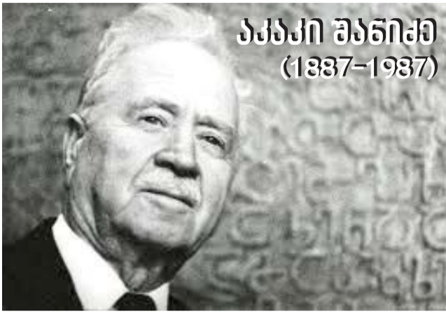
აკაკი შანიაგი (1887-1987)

აკაკი შანიძე თურმე ძალიან განიცდიდა, რომ ქართული დამწერლობის უძველესი სახე – ასომთავრული – დავიწყებას მიეცა. ამიტომაც ფიქრობდა, რომ თანამედროვე ქართულში მთავრული ასოები აღედგინა, ხოლო თავად მიმწერის დროს, წინადადების დასაწყისში და საკუთარ სახელებთან, ყოველთვის იყენებდა ასომთავრულს. ამის დასტურია მისი ხელმოწერა.