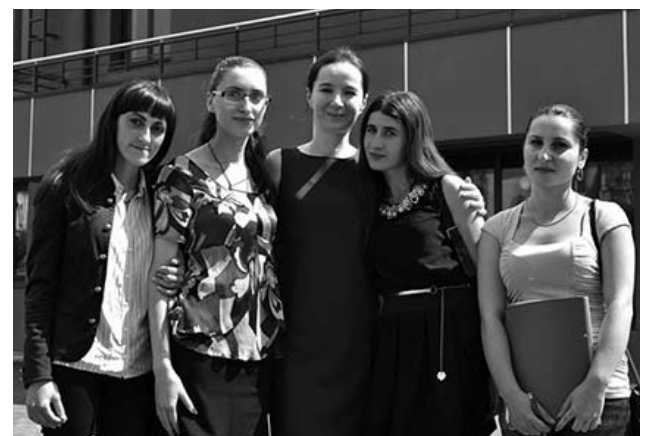
ვემსახურით აფხაზეთიდან დევნილ სტუდენტებს, ასევე სოციალურად დაუცველის სტატუსის მქონე ახალგაზრდებსაც. საერთო საცხოვრებელი, ამავდროულად, გათვლილია ერასმუსის პროგრამის ფარგლებში მონეულ პროფესორებსა და სტუდენტებზე.“

თეონა ხუფენია, შოთა მესხიას ზუგდიდის სახელმწიფო სასწავლო უნივერსიტეტის რექტორი: „განათლების სამინისტროს მხარდაჭერით და სრული დაფინანსებით, ჩვენთან რამდენიმე პროექტი განხორციელდა, მათ შორის ყველაზე მნიშვნელოვანია საერთო საცხოვრებელი, რომელიც უნივერსიტეტის, ასე ვთქვათ, საოცნებო სტრატეგია იყო, განუხორციელებელიც კი. დღეს კი, შემოიღია ვითარება, რომ ეს უკვე რეალურად და შეგვიძლია, უპირველეს ყოვლისა, უფასოდ მო-