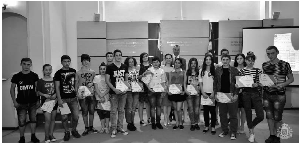
სო ვიდეორგოლს შორის, მათი რჩეული გამოავლინეს და სამაგისტრო პრიზი გადასცეს.

საქართველოს განათლებისა და მეცნიერების სამინისტროში შექმნილმა სპეციალურმა კომისიამ 66 ვიდეორგოლი განიხილა, რომელთაგან 10 საუკეთესო შეირჩა.