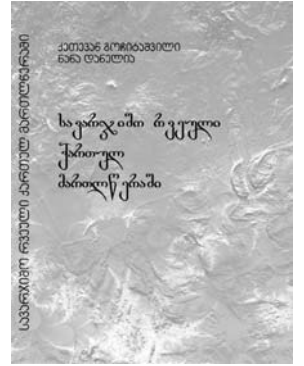
სამარჯვლო რვეული ქართულ მართლმადიდებლურ საზოგადოებრივ ცენტრში