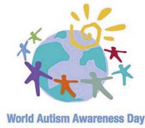
World Autism Awareness Day