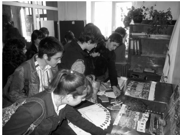
ნატოს კუთხის გახსნა

- 2004 წელს, როცა მივიღეთ „კანონი ზოგადი განათლების შესახებ“, სკოლა მაშინაც იყო დეცენტრალიზებული და დემოკრატიული, თუმცა არა სისტემის დონეზე. გახსოვთ, ალბათ, დიდი აჟიოტაჟი ატყდა სამეურვეო საბჭოების ირგვლივ, სრულიად გადაჭარბებული და არაეფექტური მოლოდინები შეიქმნა. მაშინაც ამ აზრის ვიყავი და ახლაც ასე ვფიქრობ - სამეურვეო საბჭოს მიერ დირექტორის არჩევა ძალიან დიდი შეცდომაა. არაფერი სიკეთე ამას სკოლისთვის არ მოუტანია. მე ნორმად მიმაჩნია, რომ დირექტორი დაინიშნოს. ეს ნიშნავს პროფესიონალური საკითხია და არ შეიძლება მისი გემოვნების დონეზე გადაწყვეტა. არავითარი კომპეტენცია ამ საკითხში მშობელს და პედაგოგს არ აქვთ. ჩვენ მივიღეთ სურათი, როცა დამსაქმებელს ირჩევს დამსაქმებელი, მივიღეთ დემოკრატია (უფრო სწორად დემოკრატიის თამაში), მაგრამ გაუკუღმართებული ადმინისტრირება. დირექტორი აუცილებლად უნდა იყოს პროფესიონალი და თუ ეს ასე არის, ვინც აირჩია, მისი პასუხისმგებლობის საკითხი უნდა დადგეს. რომელი სამეურვეო საბჭოს პასუხისმგებლობის საკითხი დადგა ან დადგება? სკოლა პოლიტიკური ორგანიზაცია ხომ არაა, სადაც დემოკრატია უნდა ვითამაშოთ. სკოლა კონკრეტული მიზნებისთვის დაარსებული საჯარო დაწესებულებაა, რომელმაც ხარისხიანი განათლება უნდა მიანიჭოს მოსწავლეს. ეს