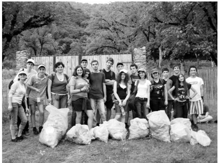
დასუფთავების აქცია ლაგოდეხში

კიდევ ერთ თვისობრივ წარმატებად მიმაჩნია სკოლის ინიციატივა, პირდაპირი კავშირი დაამყაროს რეალურ დამკვეთთან - უმაღლეს სასწავლებლებთან. დიდი ხანი არაა, რაც ეს კამპანია დაიწყო და აქცენტს, ძირითადად, ჩვენი პროფილის უნივერსიტეტებზე ვაკეთებთ. ტრადიციულად, სკოლის ძირითად დამკვეთად მიჩნეულია მშობელი. გარკვეული თვალსაზრისით ეს ასეცაა და მეც ვეთანხმები, მაგრამ მიმაჩნია, რომ სკოლის განვითარება არ შეიძლება აენყოს მხოლოდ მშობლის კერძო ინტერესებზე. ჩვენ აუცილებლად უნდა ვიცოდეთ, რა მოთხოვნა აქვს უმაღლესი განათლების სისტემას, რომელიც თავისთავად მიმზღავს შრომის ბაზარზე. ეს არ არის მექანიკური შეხვედრები. უმაღლესმა სასწავლებლებმა არ იციან როგორი სასწავლო გეგმები გვაქვს, ჩვენთვის უცნობია რა ცოდნას, რა უნარ-ჩვევებს ითხოვენ ისინი მომავალი სტუდენტისგან,