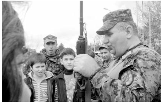
ეუფლათ ჯარისკაცთა მიმართ და დარწმუნდნენ, „ძლიერი ჯარი ქლიერი ქვეყნის იმედია“.

წინაშე და განცდილმა დიდი გავლენა მოახდინა მოსწავლეებზე. მეტი სიყვარული, ერთგულება და