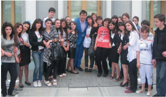
ქვეყნის კეთილდღეობის საქმეში. როდესაც ჩვენს სკოლასთან და კლასელებს...