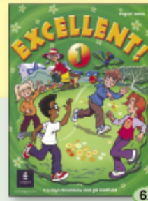
თ. მოსმელდელიშვილი ა. ბოჭორიშვილი 6.90