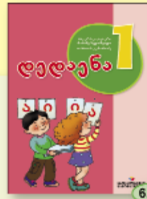
ბ. სულაკაური მ. ბედომეილი თ. კუხიანიძე 6.90