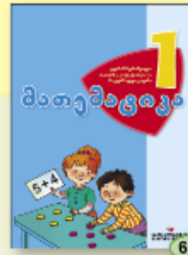
გ. ბერიშვილი ი. კოტეტიშვილი ბ. სულაკაური 6.90