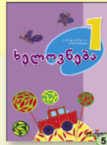
ნ. ზუნდაძე ე. ფოცხიშვილი 5.90