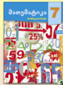
გ. ბერიშვილი ბ. სულაკაური ი. კოტეტიშვილი 5.90