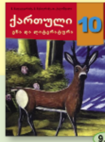
ნ. ნაფეტვარიძე მ. ნებიერიძე თ. ქიტოშვილი 9.90