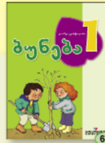
გ. კვანტალიანი 6.90