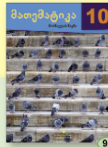
მ. ნილოსანი ნ. ნულაია ნ. ჯაფარიძე 9.90