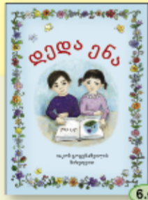
იაკობ გოგებაშვილი (განახლებული გამოცემა) 6.90