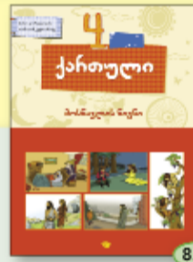
ნ. გორდეღაძე თ. კუხიანიძე 8.90