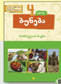
გ. კვანტალიანი მ. ბლიაძე რ. აბულედიანი 8.90