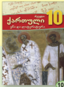
ნ. მუზაშვილი ნ. ჩუბინიძე 10.90