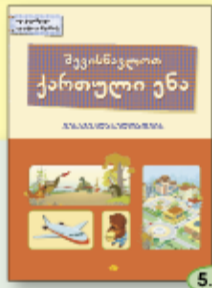
თ. ქიტოშვილი ი. ლობჯანიძე 5.90