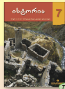
ნ. ასათიანი ნ. კვიციანიშვილი ქ. ჯანუაშვილი 7.90