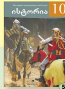
ნ. კილურაძე ლ. ფირცხალავა ც. წიკვაძე 5.90