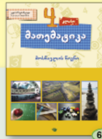
გ. ბერიშვილი ს. ზაფიშია 6.90