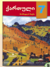
ბ. სულაკაური თ. ქიტოშვილი 9.90