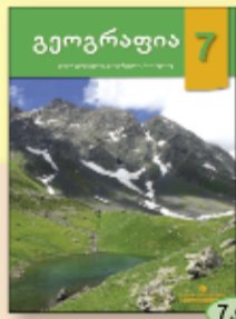
დ. კერესელიძე გ. ქანტურია მ. ბლიაძე 7.90