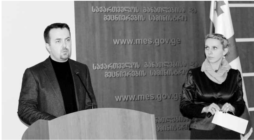
დმიტრი შაშკინი, საქართველოს განათლებისა და მეცნიერების მინისტრი: დღეიდან ვინცერთი ძალიან მნიშვნელოვანი პროგრამის, რომელიც ხელს შეუწყობს ინკლუზიურ განათლებას. საქართველოში არის შეზღუდული შესაძლებლობის მქონე ბავშვები, რომლებსაც სპეციალური ინკლუზიური განათლება სჭირდებათ. ჩვენ ყველაფერი უნდა გააკეთოთ იმისათვის, რომ ისინი ჩვენი საზო-

სარეგისტრაციო ანკეტის შესავსებად დაინტერესებულმა პირებმა უნდა მიმართონ საცხოვრებელ სახლთან ახლომდებარე საგანმანათლებლო რესურსცენტრს ან შეავსონ სარეგისტრაციო ანკეტის ფორმა ინტერნეტით, მისამართი - www.mes.gov.ge